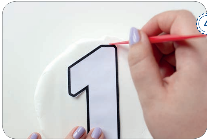
Mit dem Modellierwerkzeug die Kontur der Zahlen-Schablone auf die FIMOair light Platte übertragen.