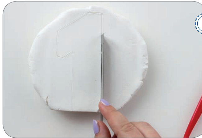
Schablone entfernen und mit einem Cutter vorsichtig die Zahl ausschneiden. Wenn die Ränder etwas unsauber sind können diese noch mit dem Modellierwerkzeug geglättet werden.