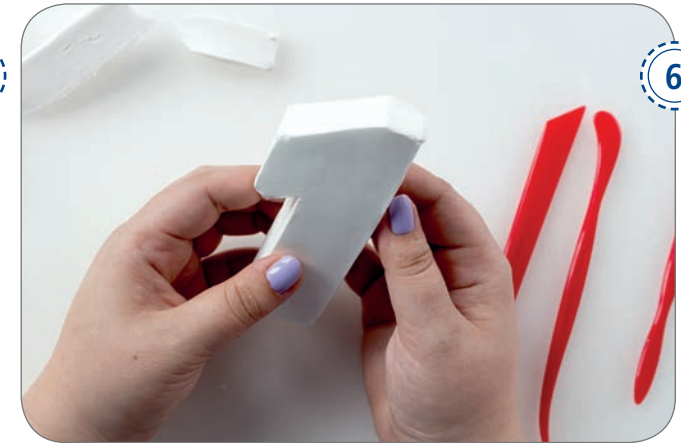
Auf diese Weise nun alle Ziffern herstellen und anschließend an der Luft trocknen lassen oder für 10 Minuten in der Mikrowelle bei 600 Watt härten lassen.

Wichtig: Bei der Härtung in der Mikrowelle ist die Gebrauchsanleitung von FIMOair light zu beachten. Es MUSS ein Glas kaltes Wasser mit in die Mikrowelle gestellt werden um ein Überhitzen zu verhindern.